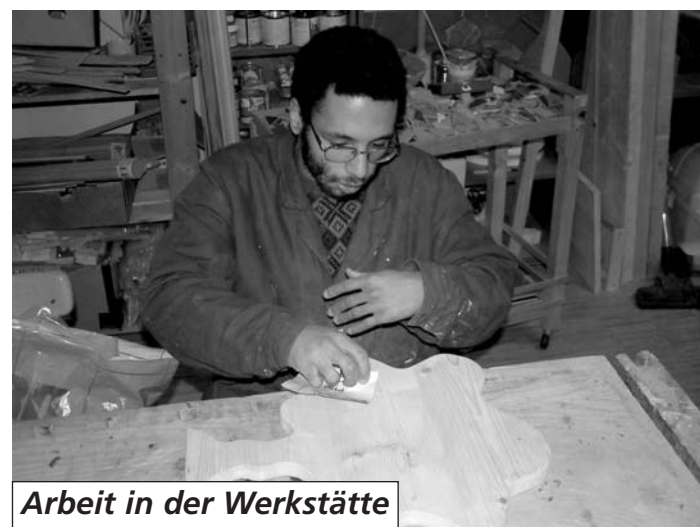
Arbeit in der Werkstätte