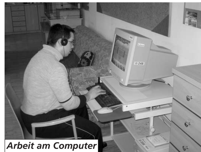
Arbeit am Computer

Der eigenständige Forschungsverein hat das Ziel, die Arbeit bei Rainman's Home wissenschaftlich aufzubereiten. Das Ziel ist vor allem angewandte Forschung. Die Wirksamkeit unserer Methoden und Konzepte soll überprüft und dokumentiert werden. Jene Spenden, die dem Forschungsverein zu Gute kommen, werden ausschließlich für Forschungszwecke verwendet. In der letzten Generalversammlung wurden die Statuten dem neuen Vereinsgesetz angepasst und den Auflagen der Finanzlandesdirektion entsprechend geändert. Wir werden den Antrag stellen, dass die Finanzlandesdirektion die steuerliche Absetzbarkeit der Spenden für diesen Verein anerkennt.