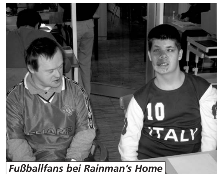
Fußballfans bei Rainman's Home

und mehrerer vorbereitender Gespräche, dauerten die Arbeiten wesentlich länger als ursprünglich erwartet. Wir hatten große Sorge um unseren frisch versiegelten Parkettboden. Wir hoffen sehr, dass die auftretenden Folgekosten auch übernommen werden. Die Logos in den Oberlichtern müssen neu angebracht werden und auch die Jalousien passen nicht mehr. Ein Vorteil ist allerdings, dass nun alle Fenster sowohl im geschlossenen als auch im gekippten Zustand sperrbar sind. Somit wird ein wichtiger Sicherheitsaspekt erfüllt. Im Juli folgen noch Malerarbeiten. Danach werden die restlichen Böden abgeschliffen und frisch versiegelt. Während der Sommermonate ist durchgehender Betrieb. Einige mögliche neue Klienten/innen werden in dieser Zeit „Schnupperwochen“ absolvieren. Mehreren Studentinnen wird die Möglichkeit zur Absolvierung eines Praktikums geboten.