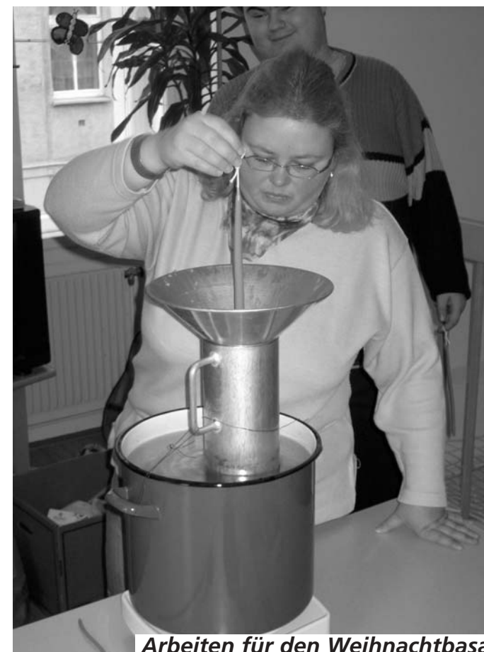
Arbeiten für den Weihnachtbasar

verbunden fühlen, schauen vorbei. Wichtig sind für uns natürlich jene, die uns ihr „Weihnachtsgeschenk“ überbringen. Es gibt einige Sponsoren, die sich unserer Sache annehmen. Wir können ihnen zwar keine Sendezeiten im Fernsehen garantieren und Auftritte in den „Seitenblicken“, dennoch stehen sie auf unserer Seite. Daher sind wir unseren langjährigen und treuen Helfern von ganzem Herzen dankbar. Allen voran ist das die Firma Schneider Electric. Sie hat vor einigen Jahren die Patenschaft über eines unserer Forschungsprojekte übernommen. Durch die bewusste Anwendung von speziellen Methoden und die besondere Gestaltung der Therapieküche werden bedeutende Impulse zur persönlichen Entwicklung unserer Klienten erzielt. Wir wollen beweisen und dokumentieren, dass der gezielte Einsatz von Arbeit und Tätigsein – den jeweiligen Fähigkeiten und Möglichkeiten individuell angepasst – das Selbstwertgefühl und das Ich-Empfinden positiv beeinflusst und Autoaggressionen und andere Formen der Aggressionen deutlich abnehmen. Entscheidend ist allerdings, dass die Beschäftigung methodengerecht an Menschen mit Assistenzbedarf herangetragen wird. Auch heuer hat sich eine Gruppe von Mitarbei-