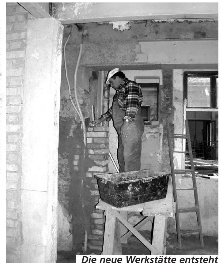
Die neue Werkstatt entsteht

Heuer im Frühjahr haben wir bei „Licht ins Dunkel“ um Unterstützung bei der Ausstattung der Werkstatt in der Teschnergasse gebeten. Erst nach Abschluss der diesjährigen Spendenaktion werden wir im Frühjahr 2005 erfahren, ob und in welcher Höhe wir mit Unterstützung rechnen dürfen. Wir haben um die Grundausstattung mit Werkzeugen und um die Übernahme eines kleinen Teils der Tischlerarbeiten gebeten. In der Vergangenheit erhielten wir von „Licht ins Dunkel“ bereits Unterstützung für besondere Projekte und sind auch diesmal zuversichtlich.