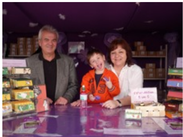
Die Arbeit am Osterstand machte allen einen Riesenspaß!

ausgedrückt, der auch zu unserem Stand kam. Der Prosecco an den warmen Tagen und die Zotter-Trinkschokoladen an den kühleren Tagen fanden großen Anklang. Der Obmann nützte die Gelegenheit, um an den kleinen Standtischen über Rainman's Home zu informieren. Stolz und völlig überrascht waren wir von der Anerkennung, die uns ein amerikanischer Tourist zeigte. Vor dem Weitergehen zückte er 100 Euro und warf sie in die Spendenbox „für unsere ausgezeichnete Arbeit“ und speziell für den Obmann, dessen Schilderungen ihn offensichtlich beeindruckt hatten.