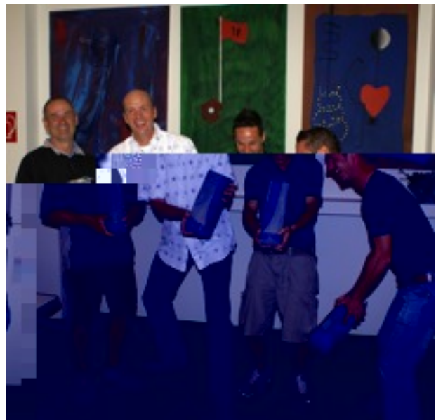
Die Sieger des Golfturniers vor den Bildern unserer Künstler!