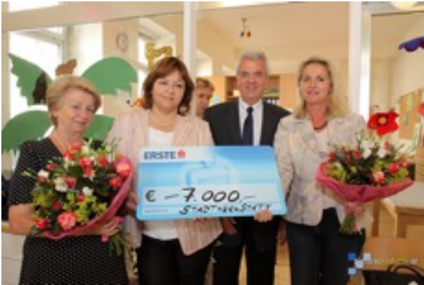
Mit dem Erlös des Ostermarktes kann der Einbau des Werkbereichs begonnen werden.

das sich durch besondere Qualität von vergleichbaren Einrichtungen abhebt. Die einlangenden Spenden, die in Bezug zu dem vorliegenden Schreiben stehen, dienen vor allem zum Ankauf von Material und Gerätschaften aus dem Bereich „Druckgrafik“.