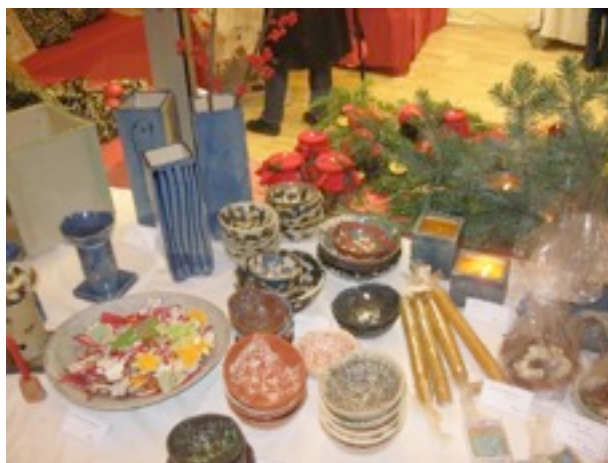
Produkte aus unserer Keramikwerkstätte