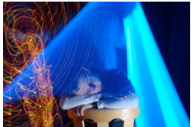
Light-Painting-Foto im Rahmen des movie-it-Filmprojekts

Ziel in unseren Entwicklungsprogrammen ist es diesbezüglich, die Betroffenen dazu zu bringen, Ruhe zu suchen und sich selbst aus prekären Situationen zu nehmen, die in Aggressionen münden könnten. Da bekommt die bewusst gestaltete Ruhezone einen ganz besonderen Stellenwert. Sie dient der Deeskalation und der Beruhigung.