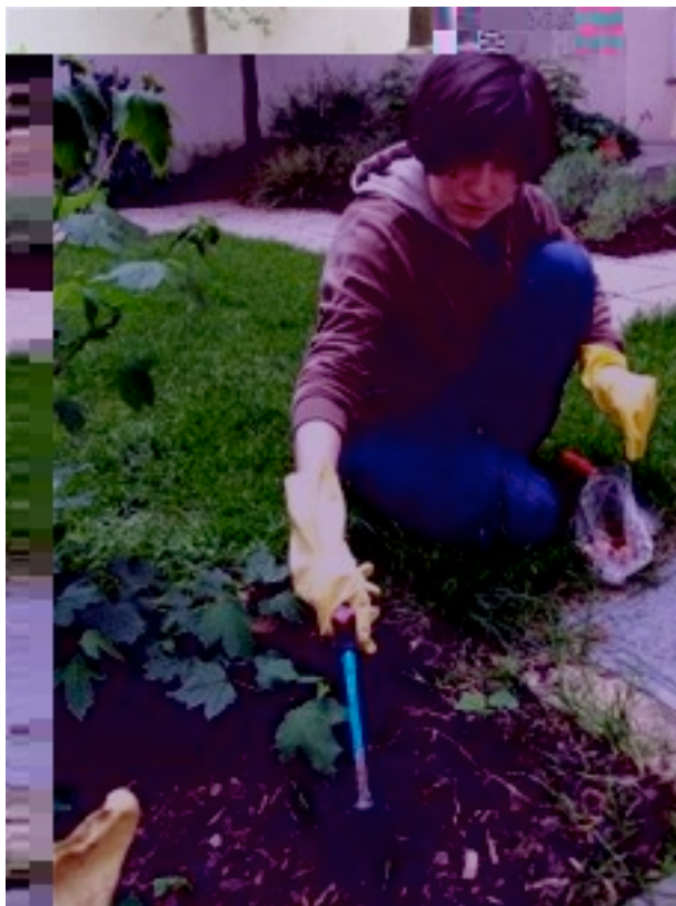
Der Duftgarten wird angelegz.

Riechen ist der Sinn, dessen Eindrücke am unmittelbarsten ins Gehirn transportiert werden. Vielfach haben wir diesen Sinn aber geradezu verkümmern lassen. Anders ist das bei autistischen Menschen. Sie fallen oft sogar dadurch auf, dass sie einen anderen Menschen buchstäblich beschnüffeln, um Kontakt herzustellen und diesen Menschen zu erleben. Wenn von autistischen Menschen, deren Problem auch als Wahrnehmungsstörung oder Reizverarbeitungsstörung umschrieben wird, speziell dieser Sinn so gezielt eingesetzt wird, dann sollten wir das berücksichtigen, um sie vermehrt zum Austausch mit der Umwelt zu bewegen.