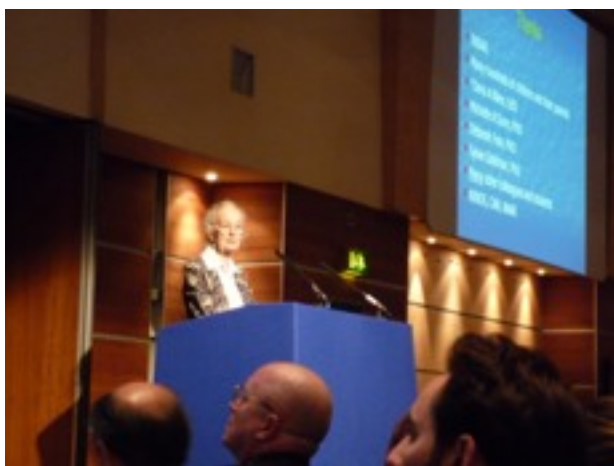
Isabelle Rapin beim IMFAR-Kongress in London.

Gerade der Aspekt der Wiener Heilpädagogik stellt aber eine wesentliche Bereicherung und logische Ergänzung dar. Während die Medizin vor allem feinste Teilschritte und auf den Gebieten der Ursachenforschung und der Gehirnforschung forciert, entspricht es dem Wesen der Heilpädagogik, aus der Warte der Interdisziplinarität das Augenmerk auf eine Gesamtsicht zu legen und den Menschen in den Mittelpunkt zu rücken.