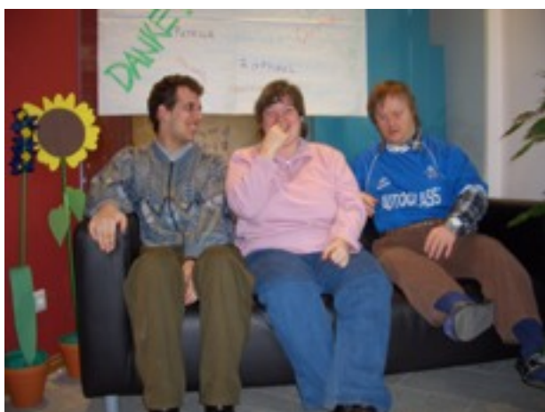
Gute Laune in der Pause in der Teschnergasse

wir können Bedingungen schaffen, die das Zusammenleben und die pädagogische Arbeit begünstigen. Wir sprechen bei unserem Konzept immer von einem „Stufenförmigen Modell“. Diese Unterteilung ist Ausdruck der Differenzierung. Folglich müssen die Raumkonzepte für die drei Stufen dieses Konzeptes unterschiedlich sein. In der Praxis zeigt sich oft erst, wie groß der Raumbedarf ist. Räumliche Enge erhöht das Konfliktpotential. Es wird daher in der Zukunft notwendig sein, eine Tagesstätte zu errichten, die besonders den Bedürfnissen unserer Gruppe für Menschen mit einem erhöhten Assistenzbedarf entspricht. Hier gilt es Nischen zu schaffen, flexible Raumunterteilungen anzustreben und vor allem auch Zugang zu Grünräumen zu eröffnen. Die positiven Erfahrungen des Innenraumes in der Teschnergasse bestärken uns da sehr.