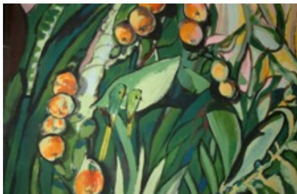
Rainman's Home – ein Pfad durch den Autismus-Dschungel.

Denn auch wenn wir bemüht sind, so viel wie möglich in Eigenleistung zu erbringen, so sind derartige Großveranstaltungen doch immer auch mit Kosten verbunden. Kosten, die sich allein durch die Beiträge der TeilnehmerInnen nicht abdecken lassen.