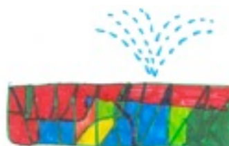
Ein großer Wunsch wird erfüllt: der Springbrunnen.

Die KlientInnen können es sich nun auch an heißen Tagen unter dem neuen Sonnenschirm auf der nigelnagelneuen Gartenbank inklusive Pölster, beides gespendet von der Boutique Stil exclusiv , gemütlich machen. Die Unterstützung durch die Geschäftsinhaber der Boutique in der Währinger Straße zeigt die enge Beziehung, die in vielen Fällen zwischen dem Bezirk und Rainman's Home entstanden ist. Zu Recht fühlen wir uns in Währing sehr zu Hause.