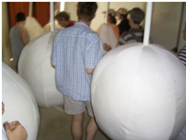
Riesige Klangbirnen hängen von der Decke.

Das Mostbirnhaus, das heuer das zweite Jahr besteht, bietet eine Mischung aus Erlebniswelt, Spielplatz und Wissensvermittlung. Für Menschen mit Autismus ist das nicht einfach nur Spaß, was da im neu gestalteten Museum in Stift Ardagger (Bezirk Amstetten) geboten wird, sondern eigentlich fast Therapie. Und für manche aus unserer Gruppe eine echte Grenzerfahrung: abgedunkelte Räume, stilisierte Riesibirnen, die von der Decke hängen und bei Berührung unterschiedlichste Töne und Klänge auslösen, optische Reize, die Aktionen auslösen wollen, und am Ende noch die Möglichkeit, durch eine finstere Röhre in vielen Windungen über mehrere Stockwerke in ein Kugelbecken zu rutschen.