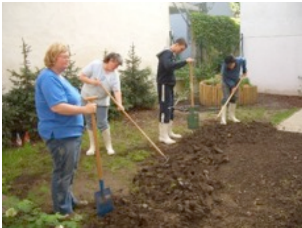
Na klar! Wir wollen kräftig mitarbeiten!

Fotos vom neuen Garten der Tagesstätte Teschnergasse finden Sie übrigens auch auf unserer Homepage unter www.rainman.at im Fotoalbum.