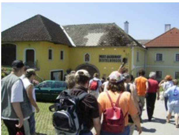
Großer Hunger treibt uns zum Mostbeurigen!

speziell bei der Bäuerin am Hof, einem für diese Region typischen Vierkanter, dafür, dass sie auch für manche Eigenheiten und „menschliche Schwächen“ unserer KlientInnen Verständnis hatte. Voller Eindrücke wurde die Heimreise nach Wien mit dem Bus angetreten. Der Ausflug am 1. Juli war ein großer Erfolg. Die TeilnehmerInnen wurden einander ein Stück näher gebracht.